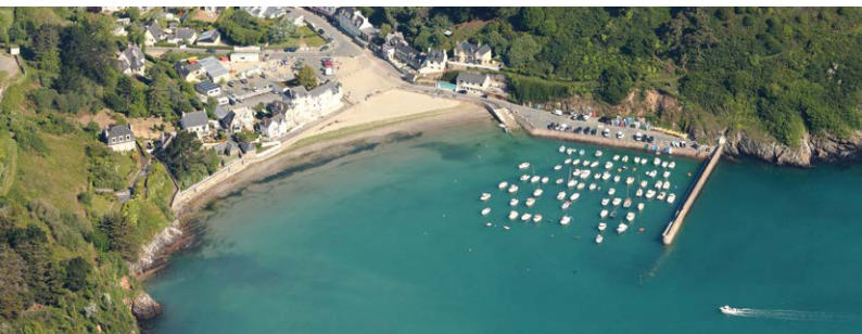
Port de Bréhec