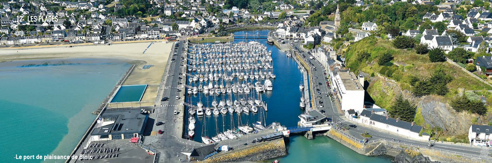
-Le port de plaisance de Binic