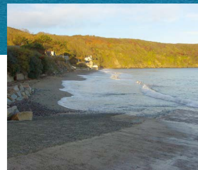
Plage de Tournemine

Dans son prolongement, la plage de Tournemine et son centre nautique renommé, vous offrira la possibilité de découvrir ou pratiquer de nombreuses activités, pour tout âge et tous niveaux.