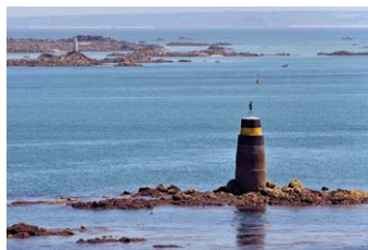
Plage de la Comtesse

La plage de La Comtesse est idéale pour un après-midi en famille. Elle s'étend entre le port de plaisance et le sémaphore. Les couleurs changeantes de son sable, au fil des marées, vous révéleront l'existence des cristaux d'ilménite noire qu'il contient. À marée basse, l'Île de la Comtesse vous invite à la rejoindre pour une escapade découverte qui ravira les jeunes aventuriers.