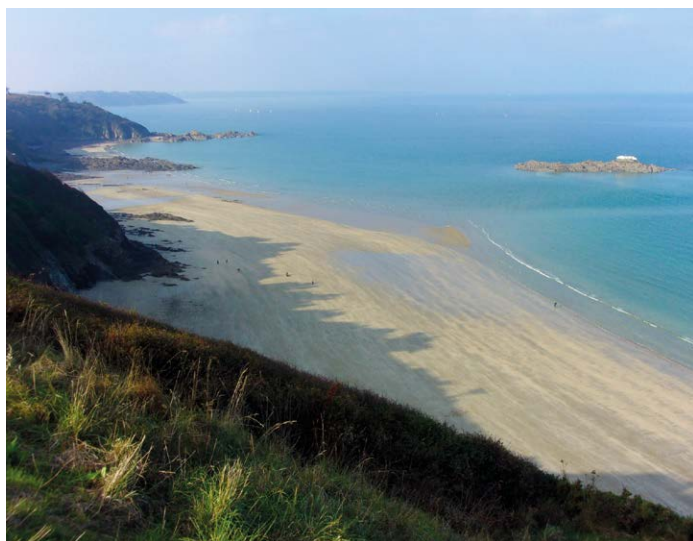
Plage de Martin Plage

Les 2 km de la plage des Rosaïres sont bordés d'une promenade qui en fait une destination prisée en toute saison. De nombreux hébergements et quelques commerces ne font que rajouter à son attractivité. Immense, vous avez toute la place qu'il vous faut pour vous ébattre : pétanque, raquettes, château de sable... ou kite-surf et planche à voile : l'espace est à vous !