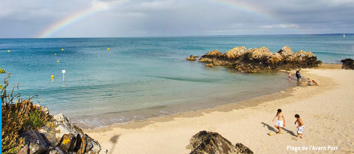
Plage de l'Avant Port