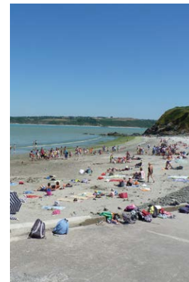
Plage de Lermot