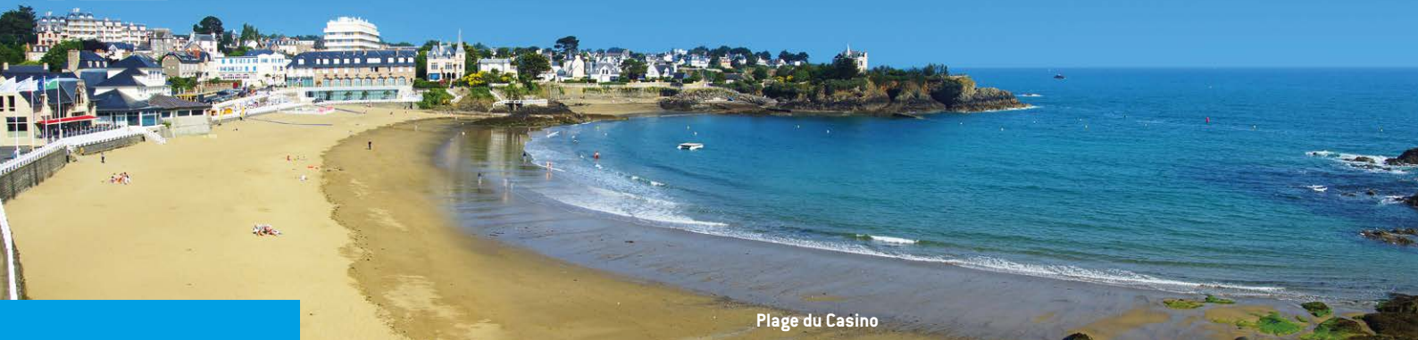
Plage du Casino