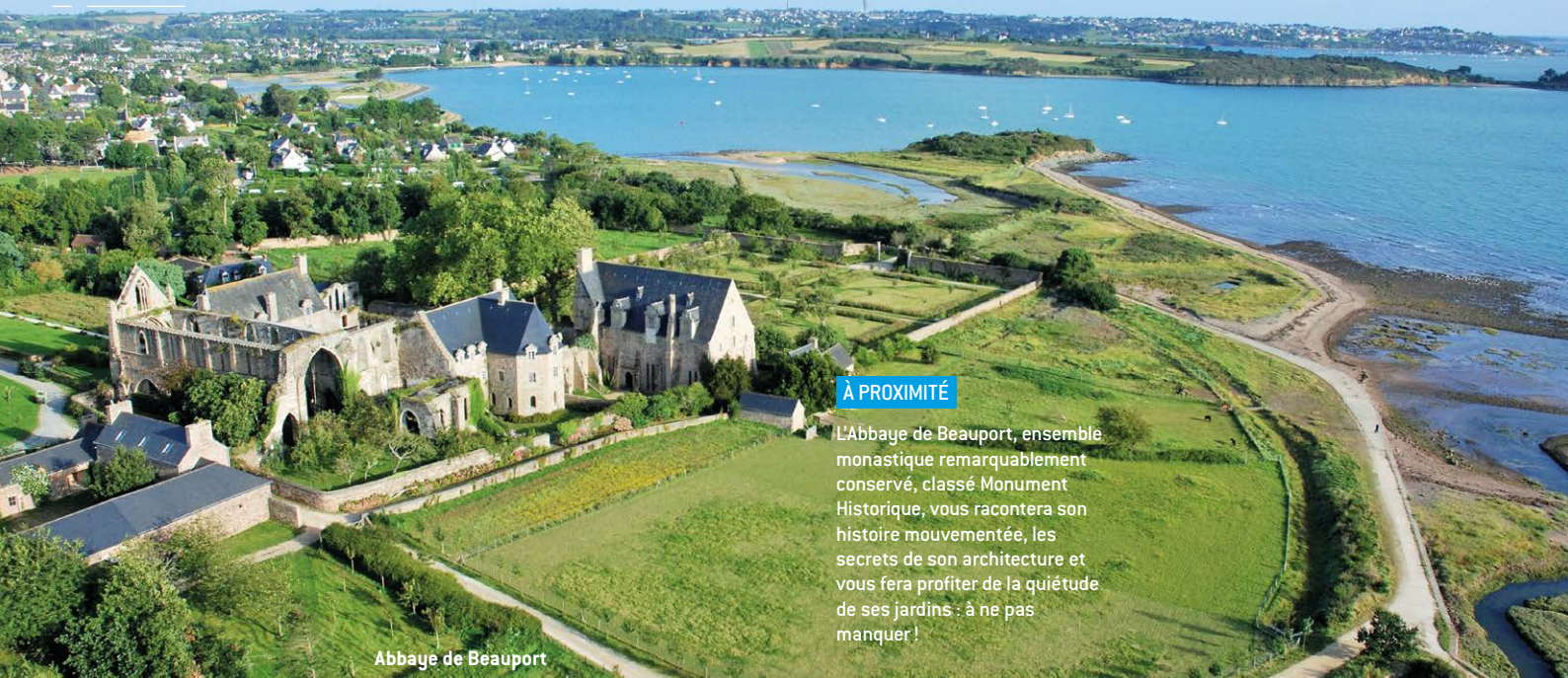
Abbaye de Beauport