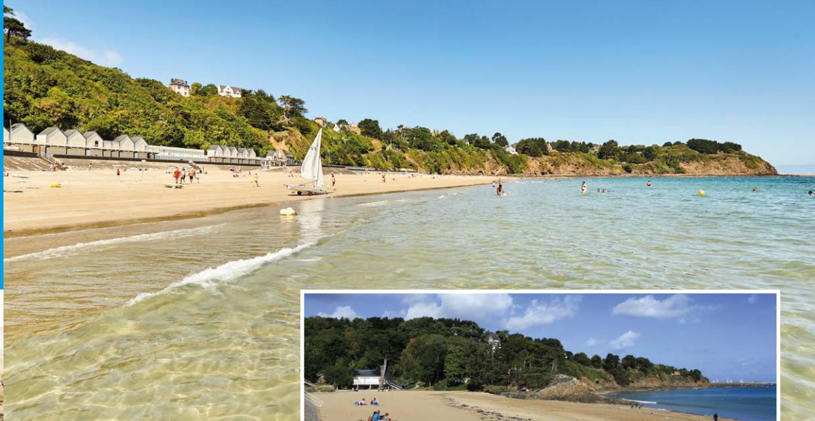
Plage des Godelins