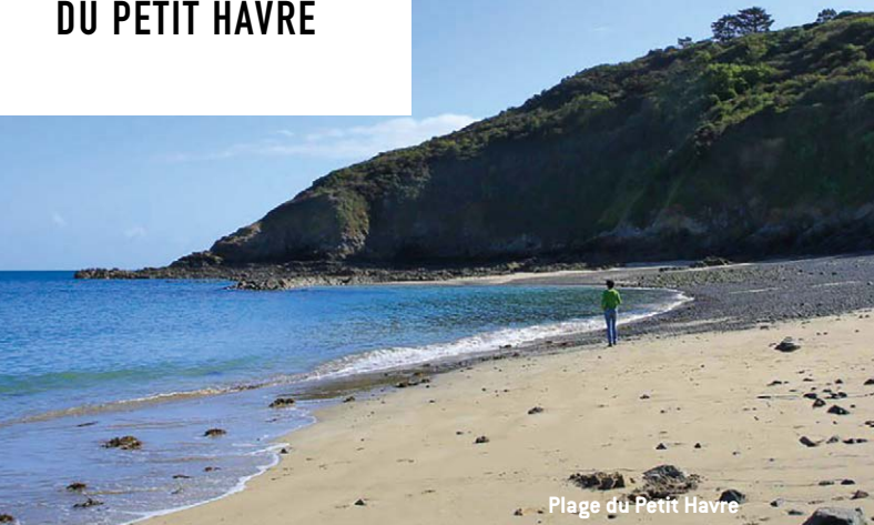
Plage du Petit Havre

Sauvage et abritée, le Petit Havre est une charmante petite plage de galets, accessible par un petit chemin goudronné et pentu. Familiale, les enfants adoreront y jouer dans les mares.