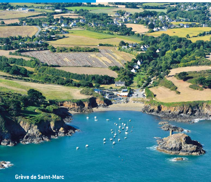
Grève de Saint-Marc