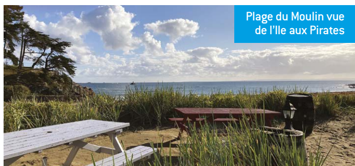
Plage du Moulin vue de l'Île aux Pirates

La plage des Godelins est bordée de falaises et possède un charme suranné avec ses cabines de bains et son esprit « belle époque ». Elle s'étire sur 1 km, possède un plongeur, propice à de mémorables souvenirs et installé sur un rocher. Elle est également très appréciée, à marée basse, par les amateurs de pêche à pied qui y découvrent un fabuleux terrain de jeu.