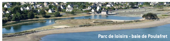
Parc de loisirs - baie de Poulafret

Familiale, la plage de Poulafret se situe derrière un moulin à marée. De nombreuses activités y sont proposées : terrain de beach-volley, jardin d'enfants, centre nautique... Elle est idéale