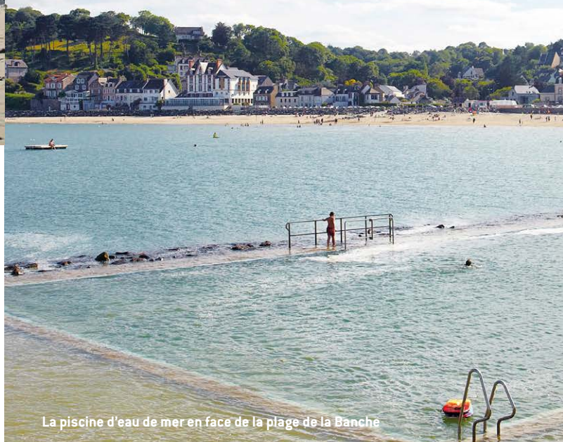
La piscine d'eau de mer en face de la plage de la Banche