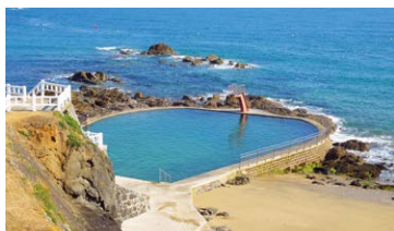
Piscine d'eau de mer entre les plages du Châtelet et du Casino

Dans un parc paysager luxuriant, le Zooparc de Trégomeur vous fait découvrir l'Asie. Ours malais, panthère des neiges, calaos, faune et flore raviront petits et grands sur 6 km d'un sentier parsemé de belles rencontres.