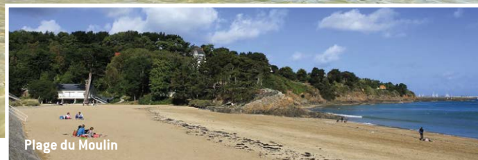
Plage du Moulin

À découvrir, 3 chapelles bâties entre le XV e et le XVIII e siècle et particulièrement celle de Notre-Dame de Bonne Espérance qui domine la mer du haut de sa falaise et d'où les femmes de pêcheurs surveillaient l'arrivée des bateaux.