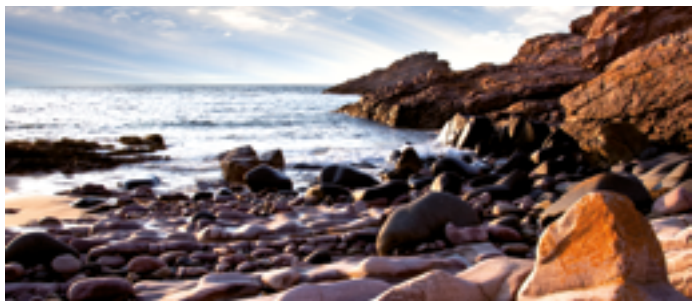
Plage de la Fosse