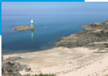
Plage aux Coquillages