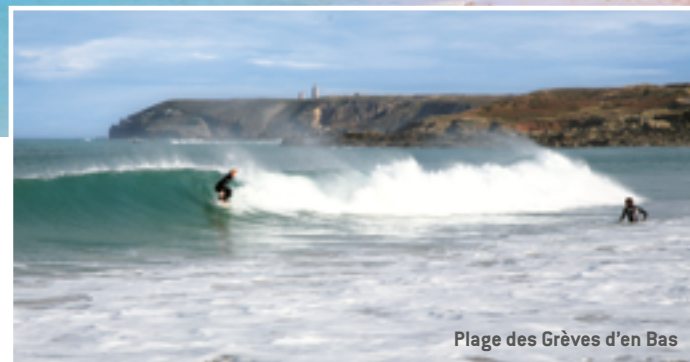
Plage des Grèves d'en Bas

À Plévenon, les vagues de la plage des Grèves d'en Bas fournissent un beau spot pour les surfeurs... et à marée basse, c'est le paradis pour les pêcheurs à pied.