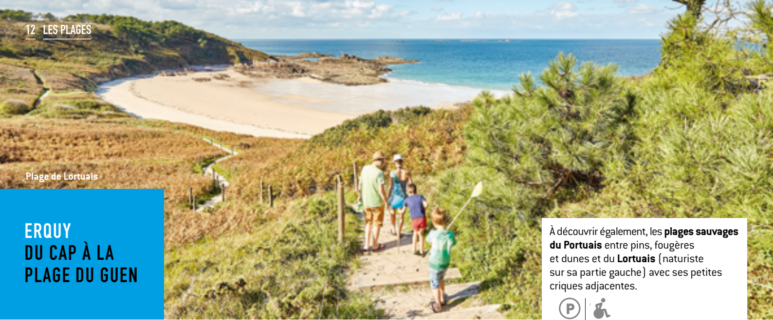
Plage de Lortuais