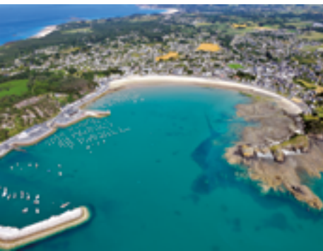
Plage du Centre

La ville d'Erquy et son grès rose sont à découvrir : son port de pêche connu pour ses coquilles Saint-Jacques à savourer sans modération, son cap aux landes remarquables, couvertes d'ajoncs jaunes ou de bruyère violette selon la saison, ses chemins de randonnées en immersion dans la nature, ses balades à marée basse... tout pour faire le plein de grand air !