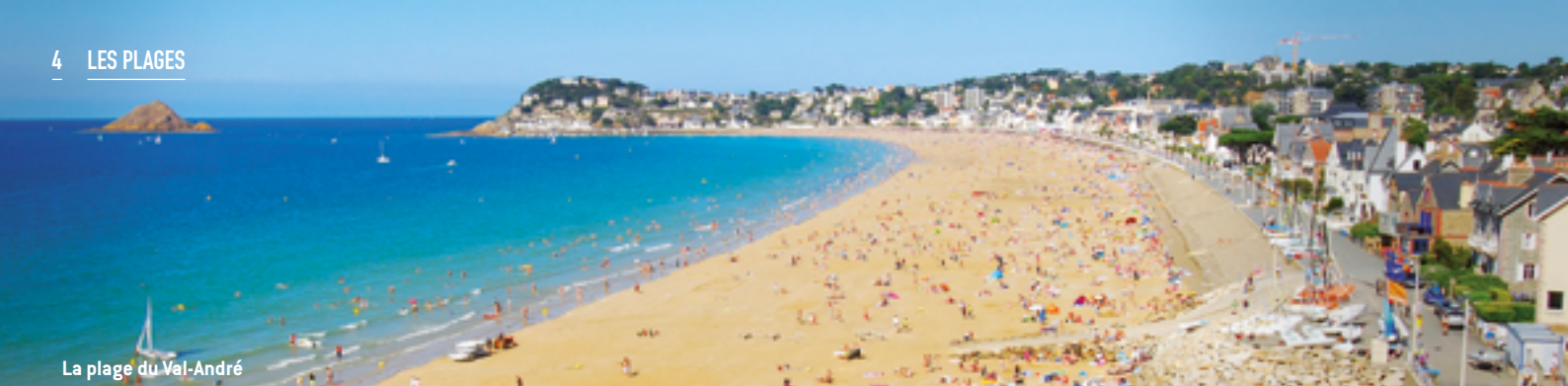
La plage du Val-André