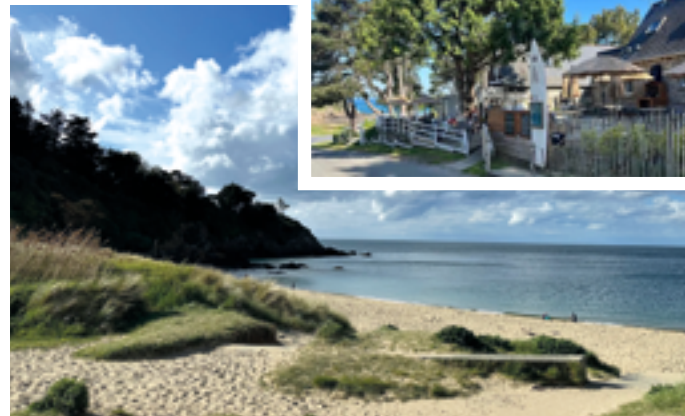
Plage de la Mare

Au premier plan, les plages de la Mare et de la Pissotte