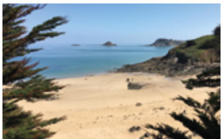
Anse du Pissot