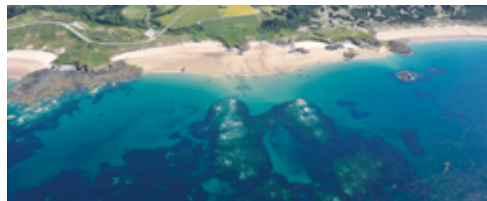
De droite à gauche, l'anse du Croc, la plage des Grèves d'en Bas et la plage de la Fosse