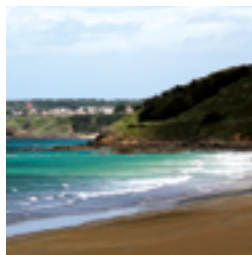
Plage de Caroual