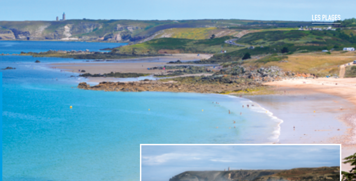
Anse du Croc - le Cap Fréhel

Sur la commune de Pléhérel-Plage, la grève des Fosses en contrebas de l'ancienne carrière de grès rose du Routin, est faite pour les amateurs de tranquillité. Quelques rochers plats sur le côté vous permettront de vous installer plus confortablement que sur les galets.