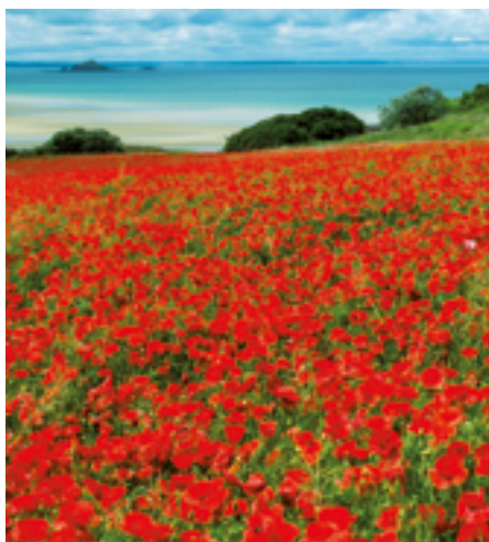
Plage de Saint-Pabu

Pour pratiquer le char à voile (à partir de 9 ans) ou pour louer surf, paddle, bodyboard, kayak... la base nautique de la Ville Berneuf est idéale.