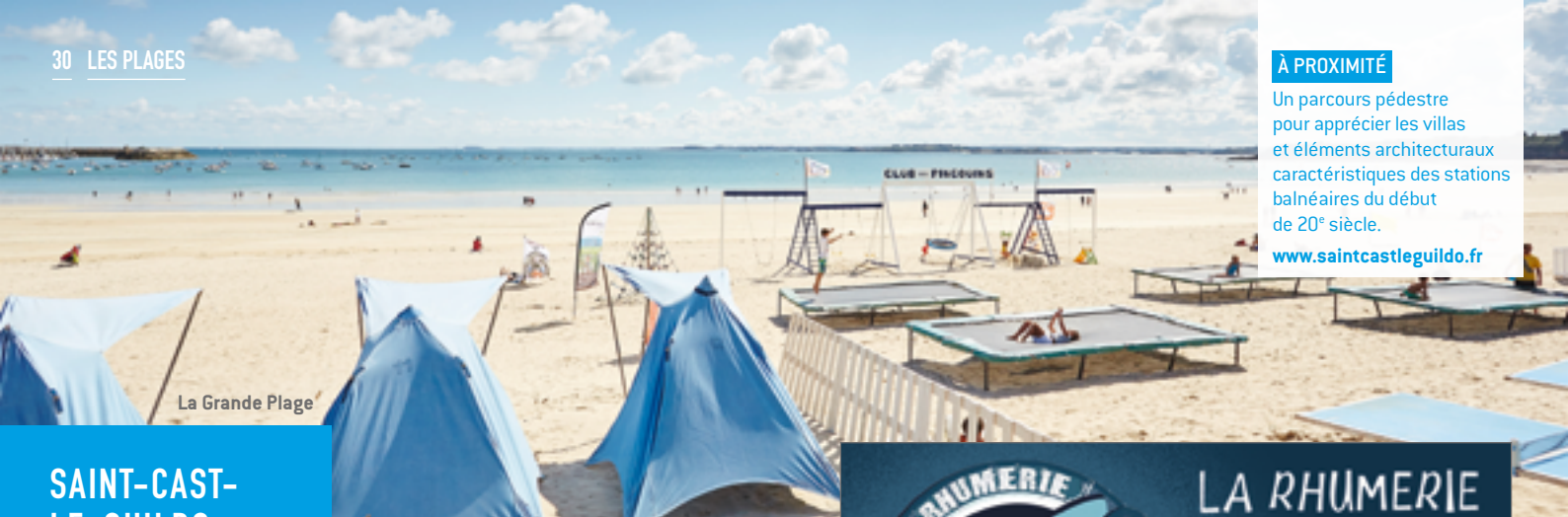
La Grande Plage