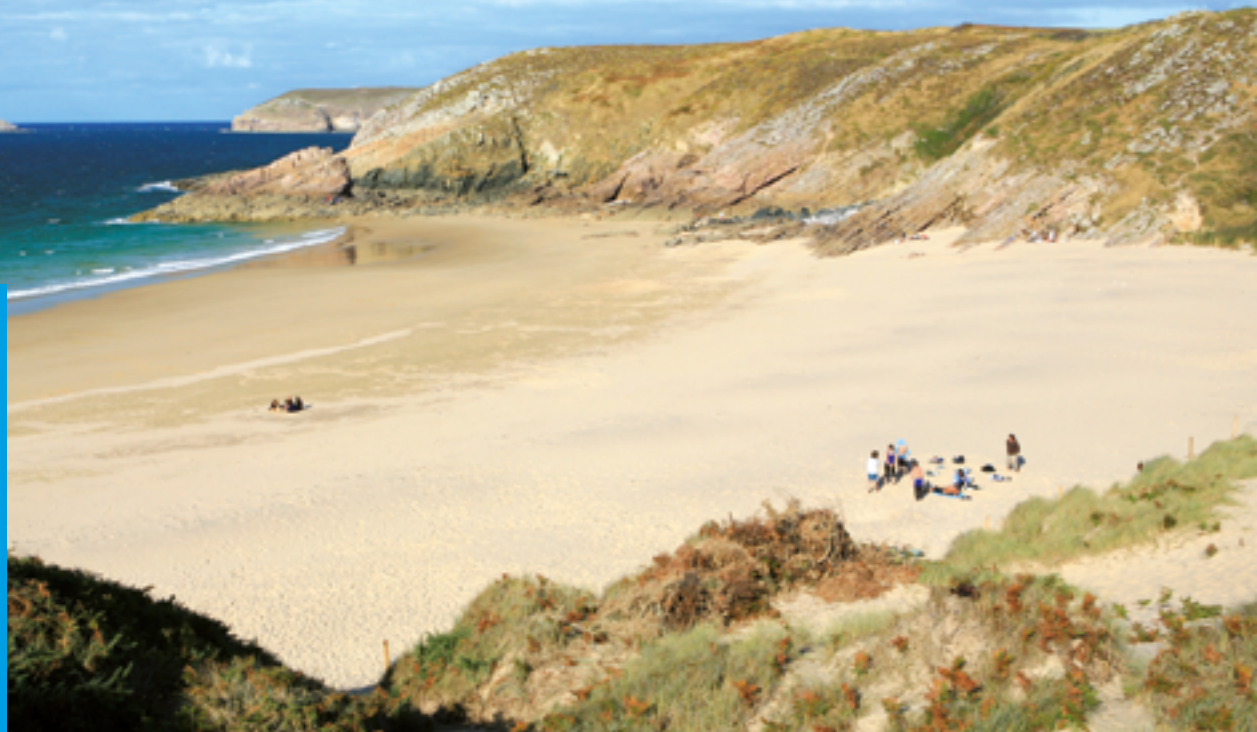
Plage de la Fosse

Sauvage, la plage de la Fosse est une magnifique crique de sable fin de 250 m. Elle offre une superbe vue sur le cap Fréhel.