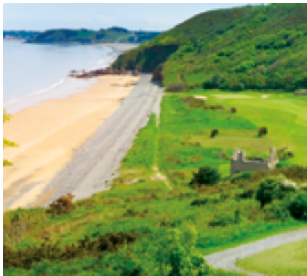
Plage de Nantois

Plage de Nantois avant Ville Berneuf en contrebas du golf. Plage naturiste